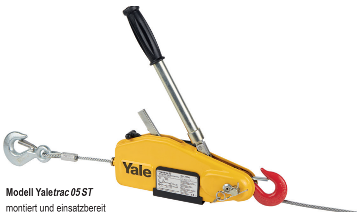
Modell Yaletrac 05 ST montiert und einsatzbereit