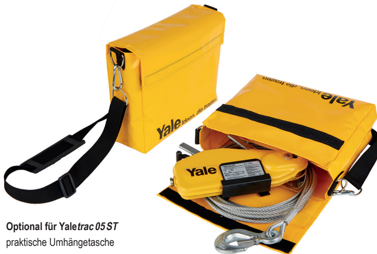
Optional für Yaletrac 05 ST praktische Umhängetasche

MODELLERWEITERUNG JETZT AUCH MIT 500 daN ZUGKRAFT! FÜR DEN MOBILEN EINSATZ