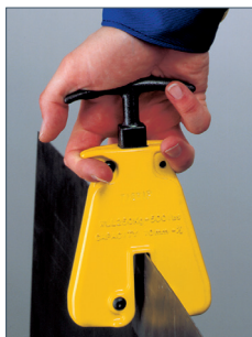
Auf- und Absetzen