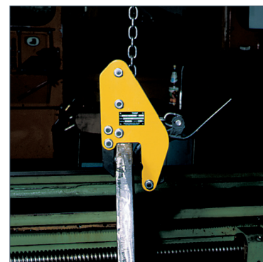
TWG Allzweckgreifer mit geringen Baumaßen für den Einsatz an schwer zugänglichen Stellen (z. B. Drehbank).