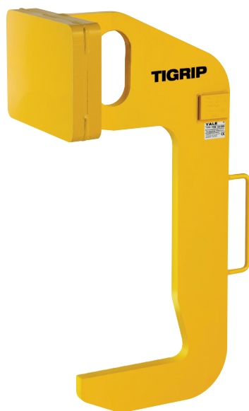
Die Abbildung zeigt die Standardausführung mit 3/4 Zinken