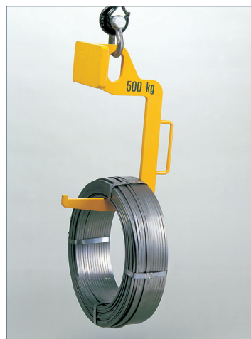
TCK Sonderausführung mit 4/4 Zinken und Sicherheitsnase